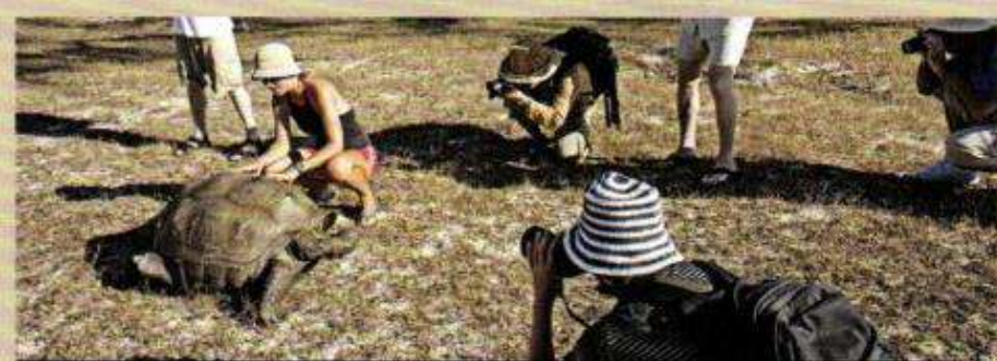
> Les touristes, même « verts », risquent de perturber les écosystèmes.

les exemples utilisés pour appuyer ces arguments.