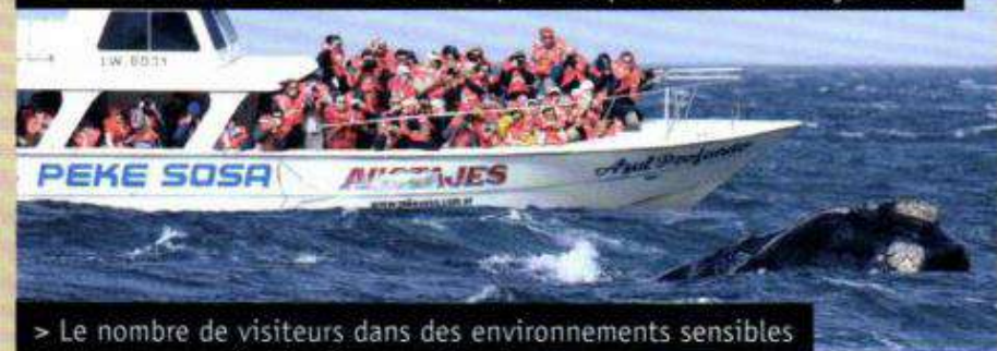
> Le nombre de visiteurs dans des environnements sensibles s'est accru ces dix dernières années.

1 Observez ces photos et les légendes. Que comprenez-vous ?